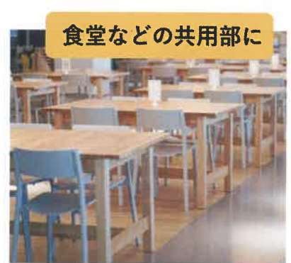
食堂などの共用部に