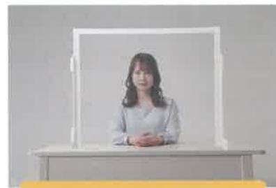
乱反射防止タイプ