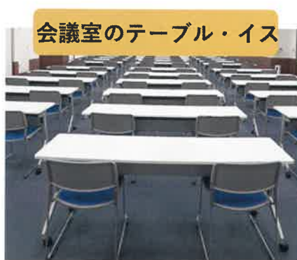
会議室のテーブル・イス