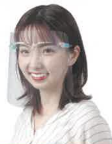
乱反射防止タイプ