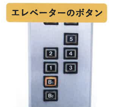
エレベーターのボタン