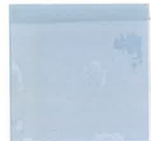
NOF改抗菌PLUS 透明 0.3mm