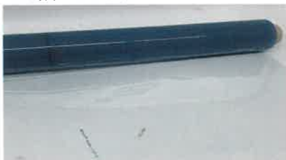
フィルムセンターに防災ロゴプリント有