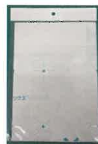
A4サイズパック 5枚入