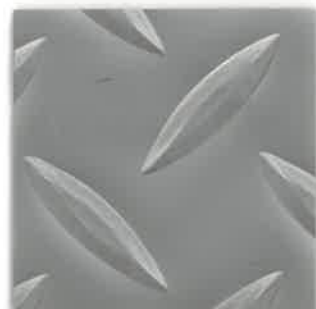
ヤバネマット 厚1.4mm×巾920mm