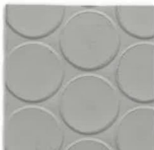
コインマット 厚1.3mm×巾920mm