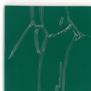
平板マット（ツヤ） 厚1.5mm×巾920mm